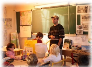
Sensibilisation et accompagnement